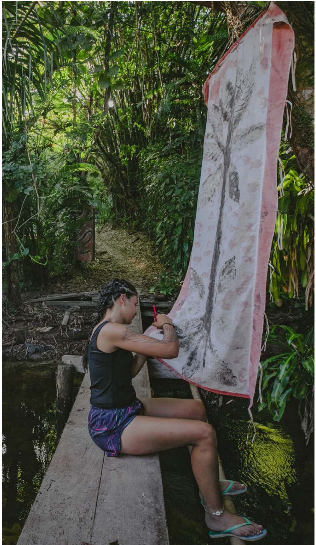
A intervenção “Feitiço contra- colonial” (2023) é composta por “4 folhas de cacau” (painel I) e “O abraço da Jiboia” (painel II).