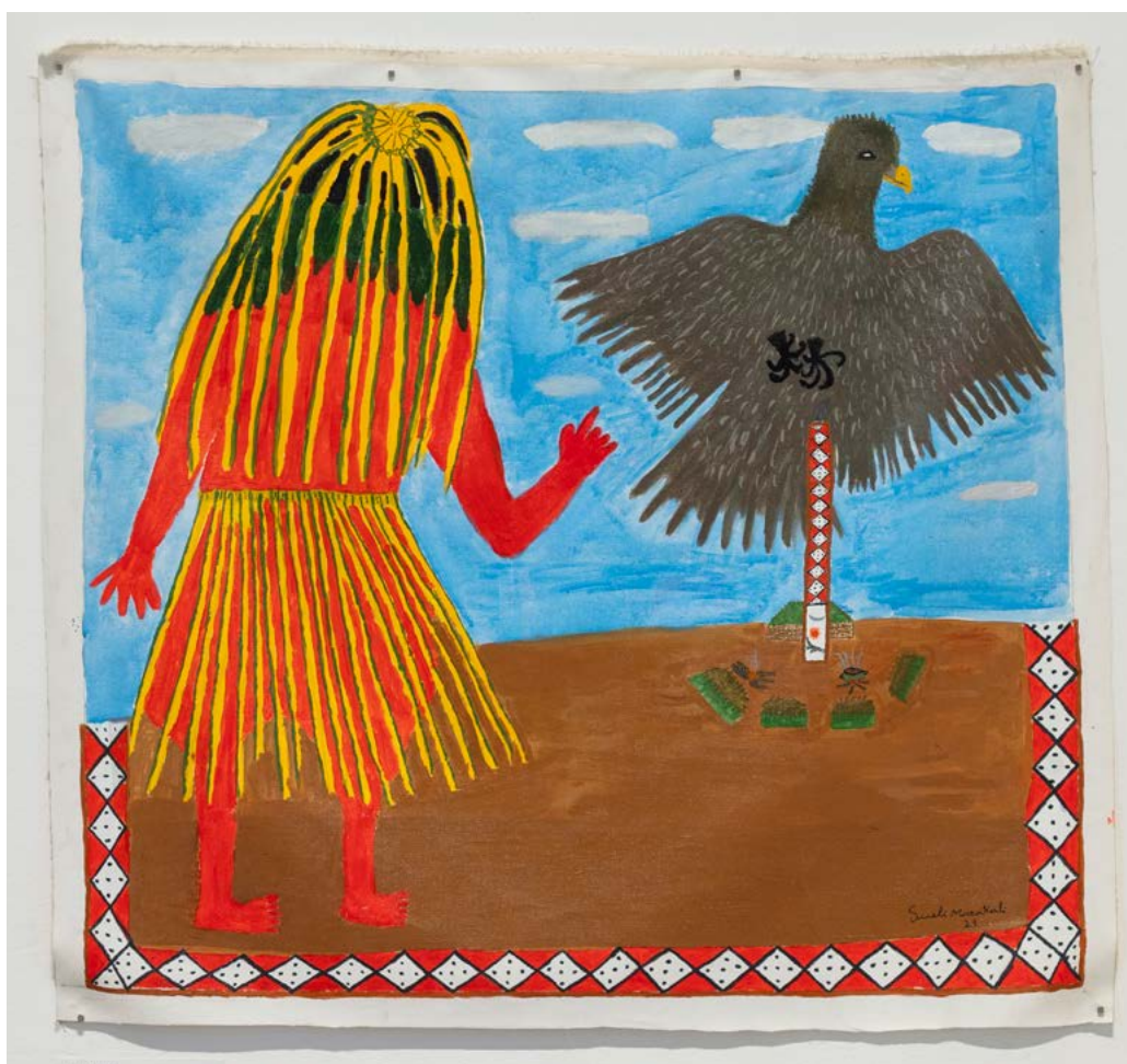
Pintura: Sueli Maxakali

Conta um dos cantos de Mōgmōgka Tap que, uma vez, ele saiu pelo mundo para conhecer outras matas e, quando estava longe, sentiu saudades da floresta onde vivia, especialmente de sua árvore favorita. Mōgmōgka Tap decidiu retornar para casa e conta no canto tudo que ele via lá do alto durante sua viagem de volta: o céu, as nuvens, as montanhas, os rios, os bichos. Mas, chegando perto, logo percebeu que tudo estava diferente, não havia mais as árvores grandes, nem as caças, mas só capim. Ao chegar ao lugar onde esperava encontrar sua árvore favorita, Mōgmōgka Tap pousou triste na estaca de uma cerca de arame farpado, que marcava o limite de uma das fazendas dos brancos invasores.