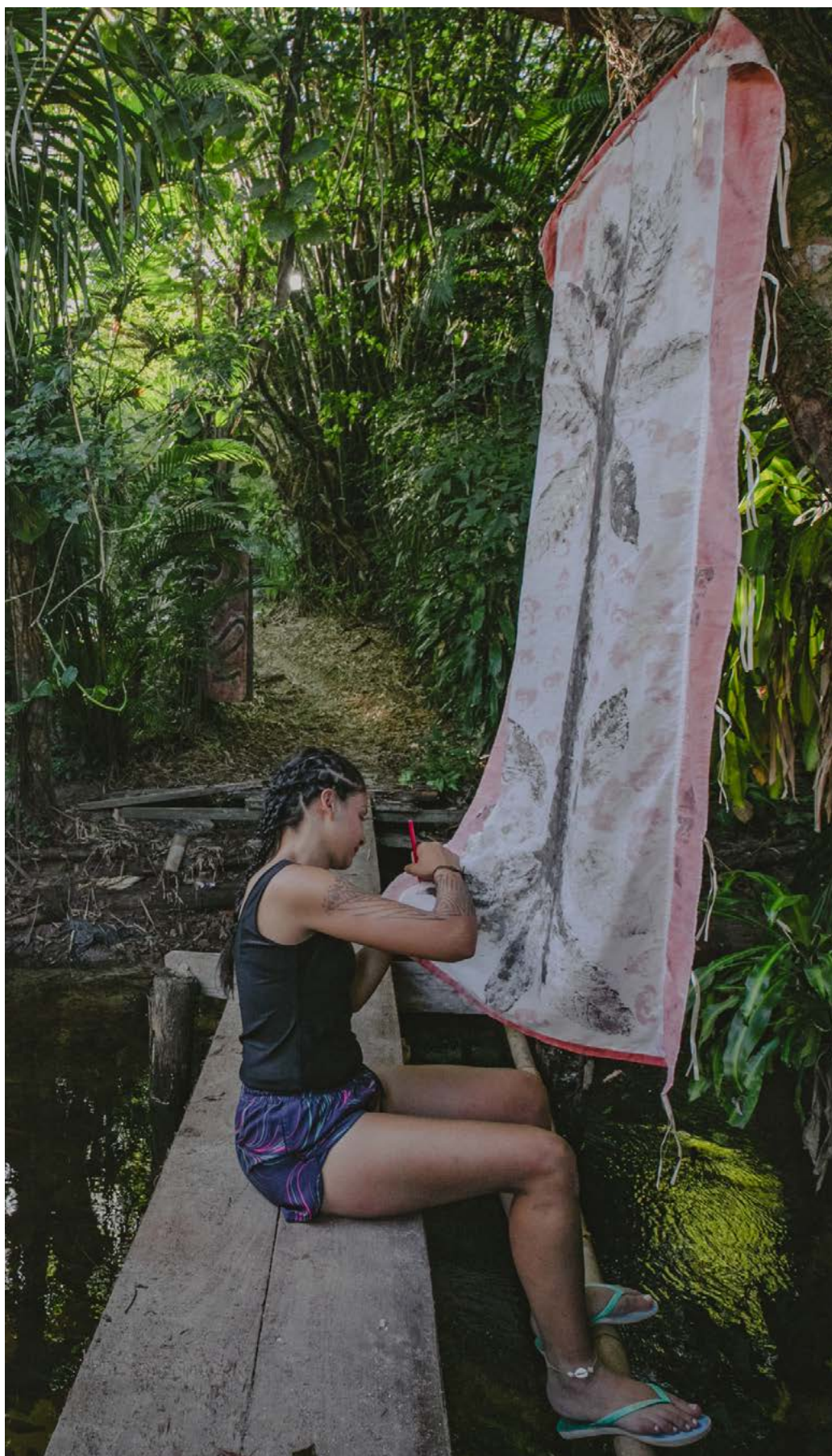
L'intervention « Feitiço contra- colonial » (2023) est composée de « 4 folhas de cacau » (panneau I) et « O braço da Jiboia » (panneau II). Photos avec la collaboration d'Isis Medeiros.